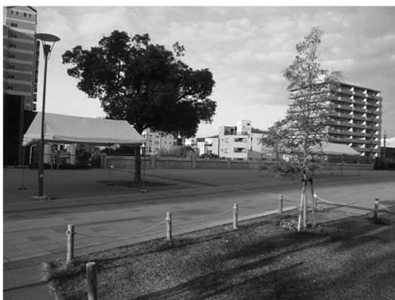
図2. 通常時の湊川公園の様子

この第二段階を念頭に置いているため、イベントを始めた2011年4月当初から、企画の趣旨に合った作家に出展を依頼して企画のレベルを維持している。また、来場者が好みの作家に出会えるかどうかまではコントロールができないため、フードブースの設置によって来場者の期待に応えている。このような活動で来場者の満足を高め、リピーターを生み、それが出展者から見て魅力となり、企画の趣旨に合う出展者を集めやすくなるといった好循環を生み出している。