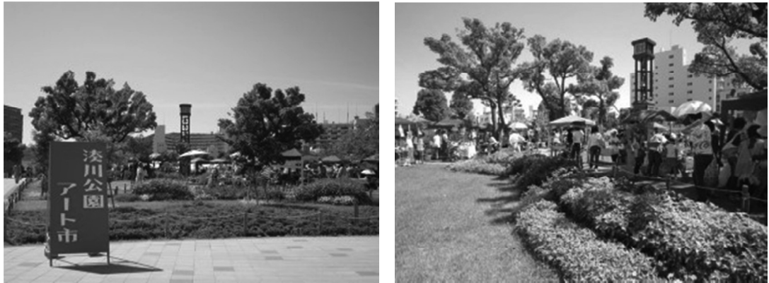
図3. アート市開催時の湊川公園の様子

図2と3は、通常時の湊川公園と、アート市開催時の湊川公園の様子である。普段は、近所の住民の散歩などに利用される公園だが、イベントの日は多くの来場者でにぎわっていることが分かる。