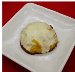
①ほぼタラバの紅白和え ②ほぼホタテの香ばしバター醤油焼き ③手作り卵焼き ④マーボー豆乳揚げだし丼 ⑤豆乳もちーずバーガー