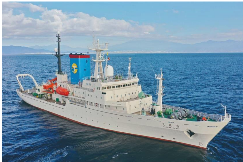
(写真1) 学術研究船「白鳳丸」

※2 海底電位磁力計 (OBEM: Ocean Bottom Electromagnetometer) : 海底地震計と同様、船舶により海底に設置し、一定期間磁場及び電場を測定する。取得した磁場及び電場データから海底下の電気の流れやすさを可視化し、流体の分布を把握することができる。