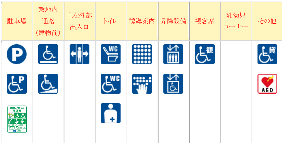
神戸商科キャンパスのユニバーサル施設情報

なお、神戸商科キャンパスのユニバーサル施設情報は下表のとおりであり、この情報は会計専門職専攻のホームページにも掲載している。