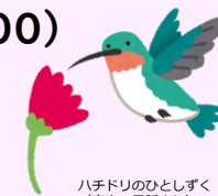
八手ドリのひとしずく （南米の民話より）