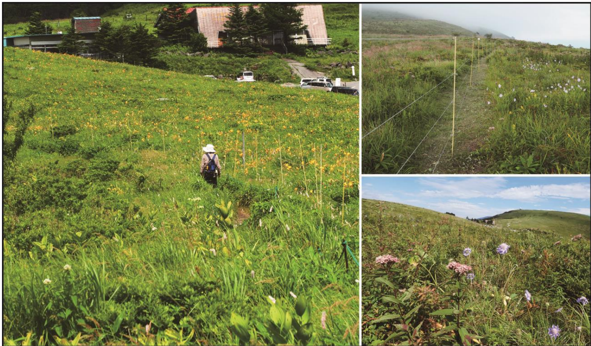
図1 霧ヶ峰高原の防鹿柵、左写真：ハイカーの右側（柵内）には保全されたニッコウキスゲ（黄色花）が咲いているが、柵外（左側）にはほとんど咲いていない。右上写真：右側が柵内で左側が柵外、右下写真：霧ヶ峰車山を望む