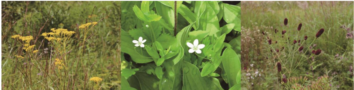
図3 写真で示したような種を指標として防鹿柵を設置することで、草原の季節的な変化や様々な色の花を保全できる可能性がある。左からオミナエシ、オオヤマフスマ、ワレモコウ