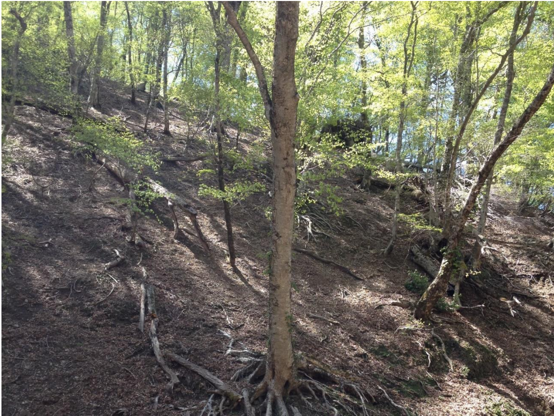
図1 芦生研究林における林床の写真。シカが好む植物はほとんど生育できていない。これと同様の現象が全国各地で起きている。