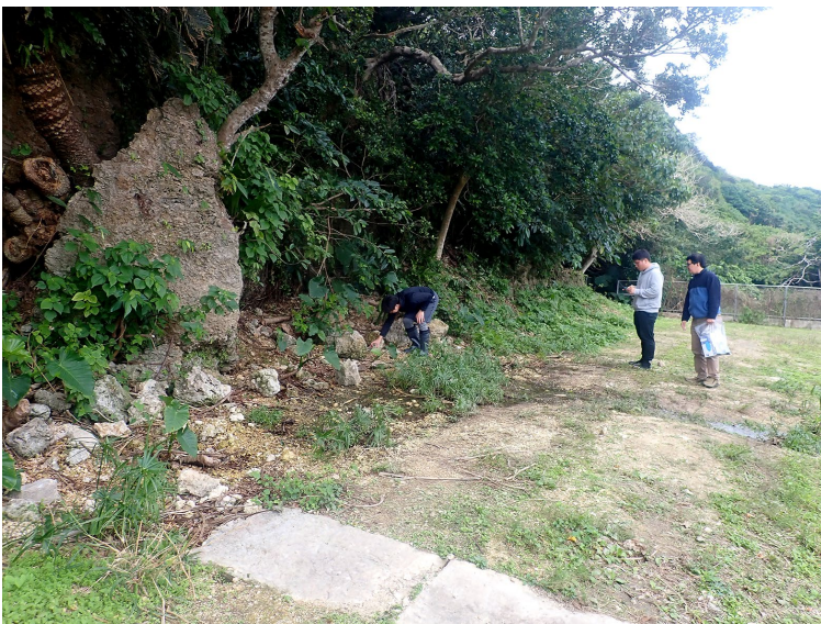
図 3. ミヤコサワガニの生息地。湧水の周辺に生息している。この場所では生息環境の面積はわずか 80 平方メートル程度しか残されていない。生息地自体は保全の対象として位置付けられていないため、土地開発や環境改変によって生息地が消失するリスクがある。写真の人物は本論文共著者の 3 名。

現在、本種は、「種の保存法」に基づく国内希少野生動植物種および沖縄県の天然記念物として法的保護を受けており、捕獲や採集に対しては厳しい規制が設けられています。しかしながら、生息地そのものには法的な保全措置が適用されておらず、土地開発や環境改変による生息地消失のリスクが依然として存在しています。自治体による買い上げや捕食者となる外来種のカメ（ミナミイシガメ）の駆除活動などは進められているものの、長期的な保全を実現するためには、生息地保護に特化した法的枠組みを構築し、土地利用の制限など、より積極的な保全政策を実施する必要があると考えられます。