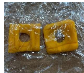
図 2. 作成したアタッチメント