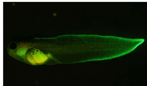
エラと尾ビレで GFP を発現するオタマジャクシ