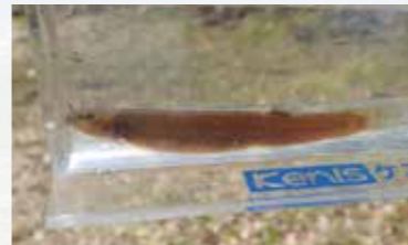
ナガレホトケドジョウ

私は本種の保全を目的として、兵庫県北部を流れる円山川水系鎌谷川流域において、約1年間にわたって捕獲調査や物理環境調査（流速、水深、水温、河床材料等の測定）、得られたデータの解析を行いました。その結果、本種は秋季から冬季にかけては流速の遅い淵を選び、1月の厳冬季は水温が比較的高くかつ安定している場所（湧水場）を選んで越冬していることを定量的に明らかにしました。さらに、魚道敷設によるスミウキゴリの分布拡大が本種の生息にマイナスの影響を与えている可能性があることがわかりました。また、本種は越冬時において積極的な移動はしていないことが示唆されました。