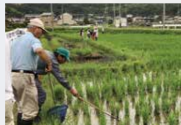
水田ビオトープの生き物調査・観察会

次に、この生き物のデータなどを元に、コウノトリの主な餌となる魚類やバッタ類を増やすビオトープやため池の浅瀬づくりなどの地域活動をコーディネートしました。2019年には積極的な活動を続けていく地域に、コウノトリが飛来し、2か月ほど滞在しました。