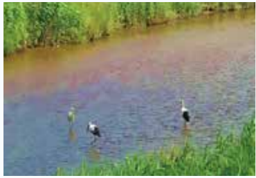
河川で採餌をするコウノトリ

この時期、出石川ではアユが繁殖のために群れをつくり、上流から中流、下流へと移動するため、コウノトリがアユを狙って河川に集まったと推察されます。以上のことから、今後も魚類等の再生産を目的とした湿地再生を継続し、小規模河川の保全とその事例を示していく必要があると考えられます。