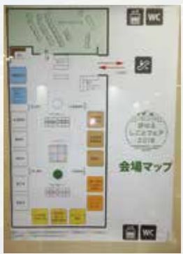
都市部で行われた移住相談会

今回の研究を通じて、移住者支援は「移住者」を増やすといった「数的」な対策ではなく、「移住者」が「住み続けられる」地域をつくるということが求められていると言えます。そのためには、移住者が移住後に生じた課題や問題等を自治体は把握し、また、受け入れ側の地域も理解することが大事だと感じました。