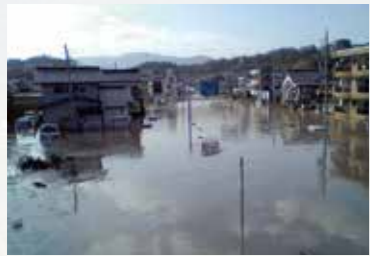
台風23号で冠水したS地区

研修の目的は「隣保長の育成」、「個々の住民が持つ地域知の共有」ですが、隣保長同士の対等な関係と自由な発言を保証したことにより、目的以上の成果が見られました。