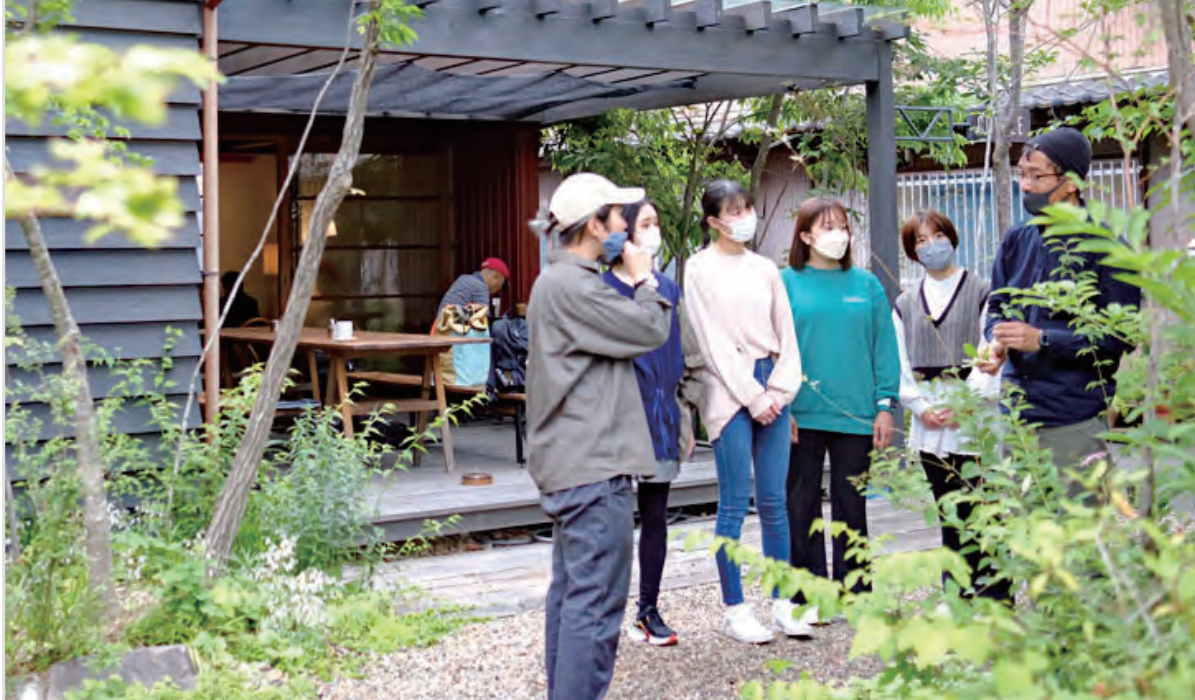
兵庫県立大学 エコ・ヒューマン地域連携センター