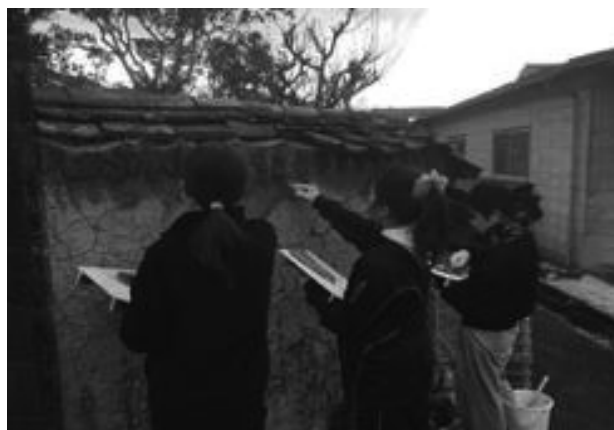
図 1：土壁を修復している場面 土壁ワークショップ 2021

前年に続き、2021 年度も思うように活動することができず、数々のイベントが中止になってきたが、今までにイベントを開催してきた連携先の方たちとのつながりが立たれないように、感染状況などを考慮しながら、オンラインミーティングやランチミーティングを軸に活動について話し合い、キャンパスツリーを支えて下さる多くの方々への感謝の気持ちを決して忘れず、たくさんの方々の活動に参加していきたいと考えている。