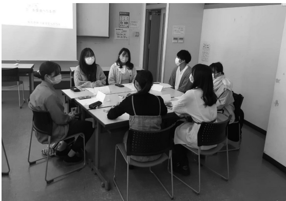
(図1) プロジェクト第2回の様子

(1) 2,000通りもの組み合わせから自分に近いセクシュアリティを分析してくれるサービス anone, https://anone.me/