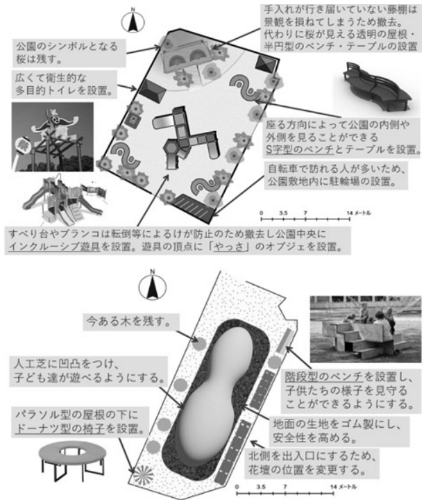
図1 ゆうかり児童公園（上）/栄町公園（下）案

それぞれの公園の現在の使用状況と今後予想される人流を考慮し、各公園において「20年後の公園の姿」として図1の様な公園レイアウトを提案した。私たちが訪れたいと思えるような公園を軸に、今後の人口動態や求められるニーズに基づいてコンセプトを設定し設備を配置した。コストの概算結果について図2の通りである。