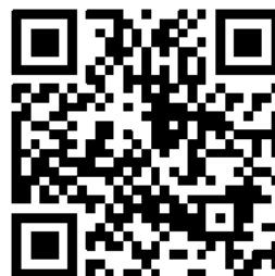
エコ・ヒューマン地域連携センター HP

新規プロジェクトや学生の声などを新しく掲載するなど、HP の情報を更新しました。「学生の声」では、1 回生が、地域連携活動に参加する先輩学生と地域プレイヤーに対してインタビューを実施・記事化に取り組みました。