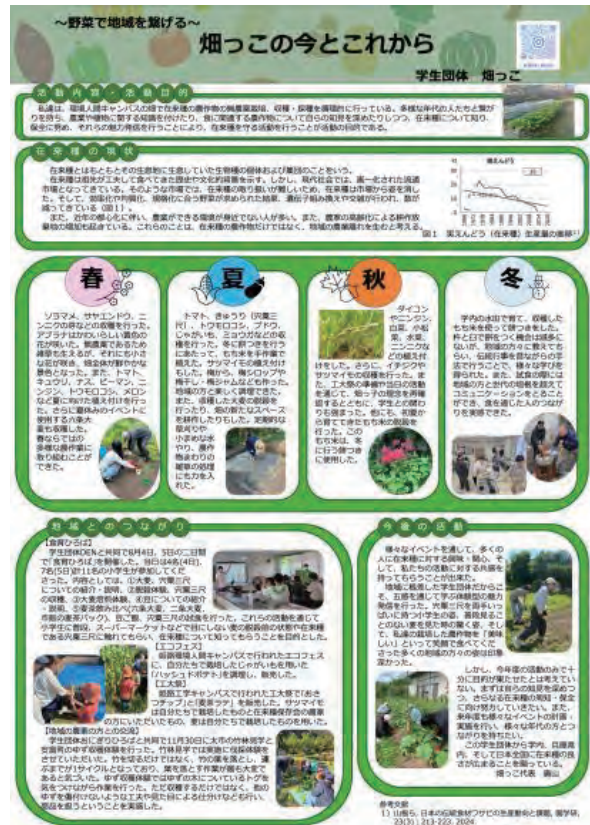
ポスター賞を受賞した畑っこのポスター (次ページ詳細)