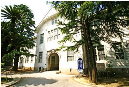
ゆりの木会館（旧本館）

兵庫県立大学環境人間学部は、旧制姫路高等学校の校地を継承しています。そのため、1923（大正12）年に創立された旧制姫路高校の本館と講堂がキャンパスに現存しています。本館と講堂は1926（大正15）年9月に竣工しました。本館は、現在「ゆりの木会館」として利用されています。今回の支部大会の会場は、この「ゆりの木会館」（旧本館）での開催となります。両建物ともに、木造の洋風建築で、外観はもちろん内部も大正時代の雰囲気を残しています。1999（平成11）年には、国の登録有形文化財に選ばれています。